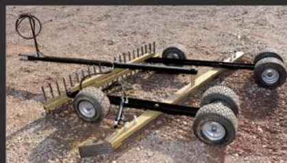
Herse de piste de 2 à 4m