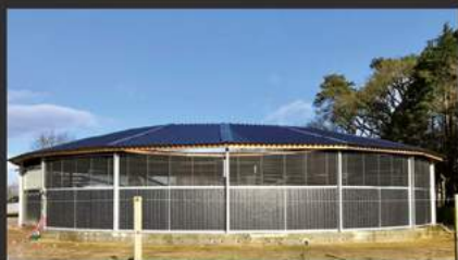
Marcheur couvert jusqu'à 24m