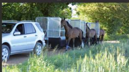
Training 4-6 places