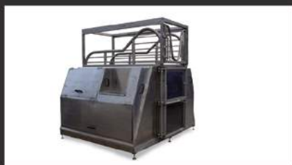
SPA eau froide 2°