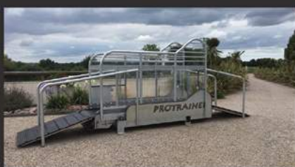
Tapis roulant grande vitesse