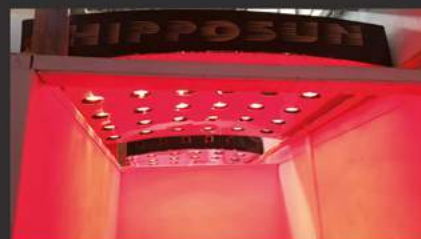
Solarium 15 et 30 lampes