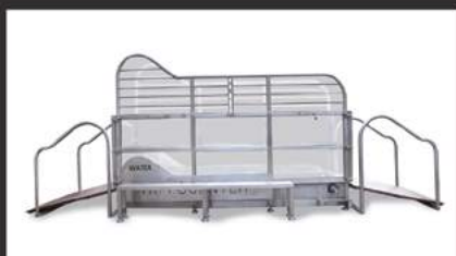
Tapis roulant aquatique